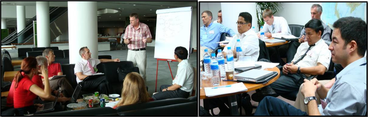
ສະມາຊິກທີມແດງ (ຈາກໂຄງການ ARTIP, IJM, ມູນລະນິທິເພື່ອນປາ, ໜ່ວຍງານຕຳຫຼວດ/ດຳເນີນງານເພີ້ນຕາເມັດເຕີ II, UNIAIP ແລະ USDO.J) ກະກຽມການວາງແຜນຍຸດທະສາດການຕໍ່ສູ້ (ດ້ານຊ້າຍ), ຜູ້ເຂົ້າຮ່ວມກຳລັງລໍຖ້າຢູ່ (ດ້ານຂວາ).