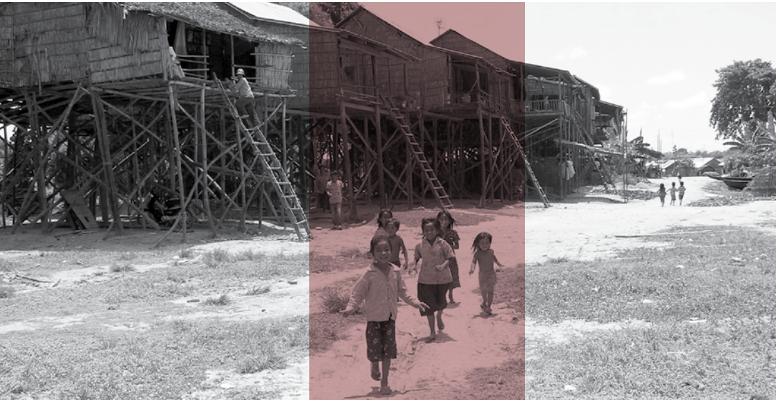
เด็กในหมู่บ้านแห่งหนึ่ง ที่จังหวัดคันทัล (Kandal) ของประเทศกัมพูชา