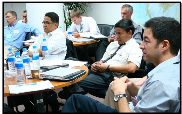
สมาชิกกลุ่มสี่แดง (จาก ARTIP, IJM, มูลนิธิเพื่อนภาพ UK Police/Operation Pentameter II, UNLAP, และ USDOJ) เตรียมจัดทำแผนกลยุทธ์การสู้รบ (ซ้าย) ตามความคาดหวังของกลุ่มผู้ฟัง (ขวา)